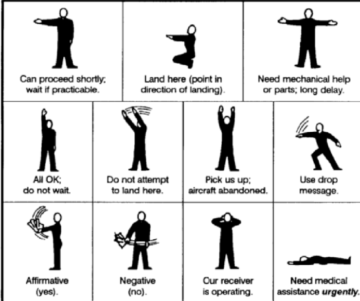
Figure 19-7. Body signals.